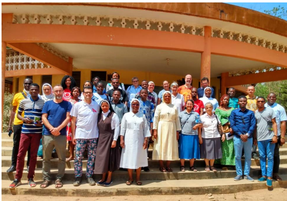
III Foro Benín (2021)

En 2021, se realizaron los siguientes espacios de encuentro y formación: