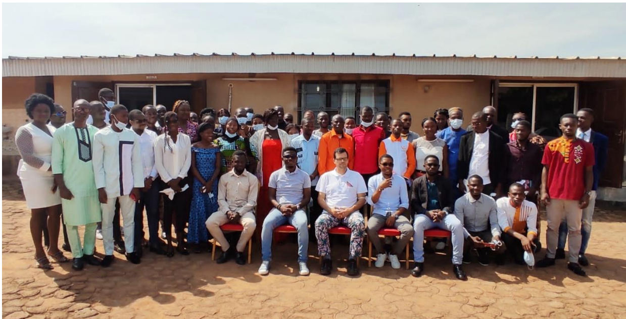
I Foro OSC Korhogo y Bouaké 2021 (Costa de Marfil).