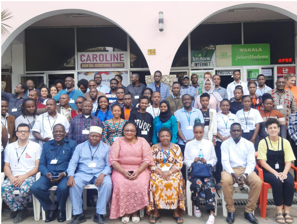
I Tanzania Fórum OSC 2021 – Arusha.