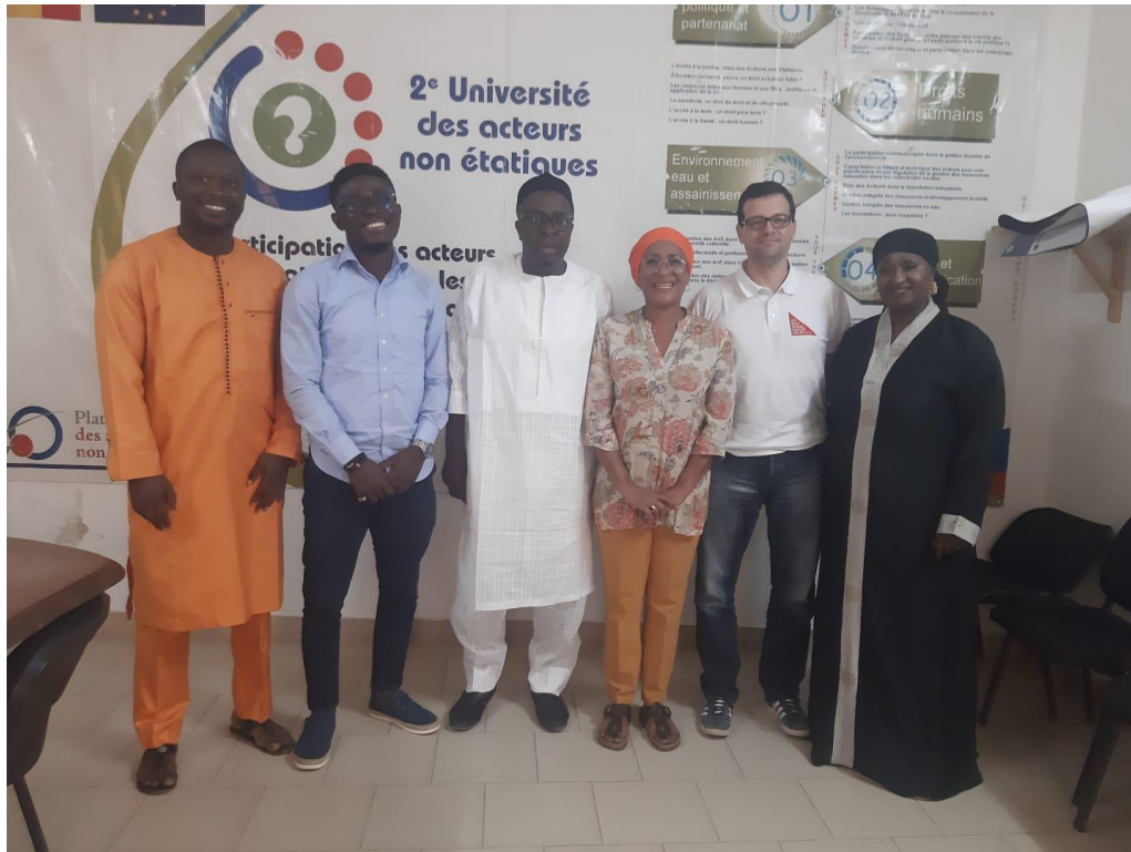
Viaje pre Foro OSC Senegal 2021.

A la vez, se apoyaron 4 proyectos de emprendimiento con impacto social en Benín, tres en Nikki y uno en Cotonou.