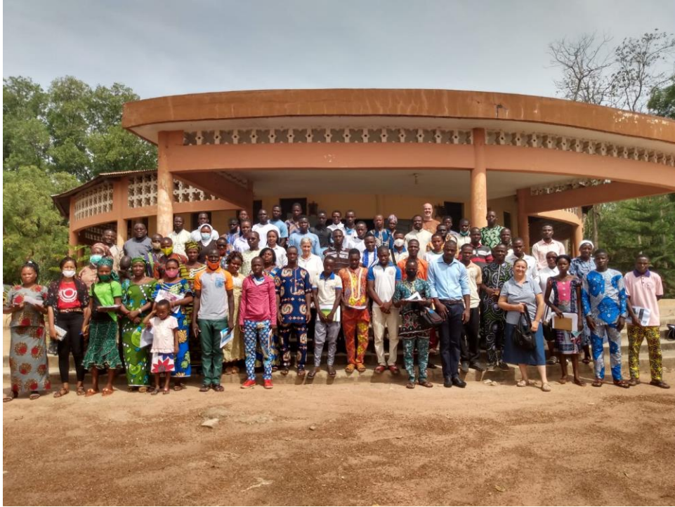
I Encuentro de formación Biocarbón. Benín (2021).