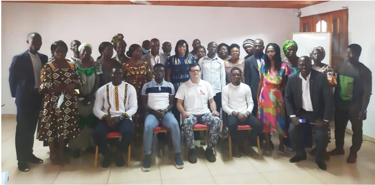
I Foro OSC Man 2021 (Costa de Marfil)