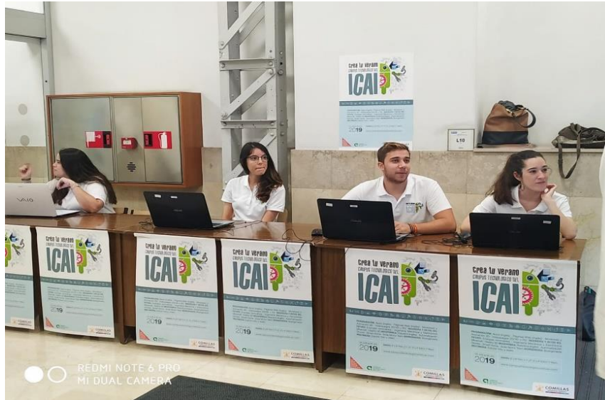
Profesores esperando la llegada de los alumnos

En el mes de junio y julio, la Escuela Técnica Superior de Ingeniería ETSI-ICAI de la Universidad Pontificia Comillas y la Fundación Salvador Soler han organizado la VIII Edición del Campus Tecnológico del ICAI; un campamento de verano en Madrid dirigido a niños/as de 9 a 17 años interesados en la ingeniería, la tecnología, la ciencia y las matemáticas. Fueron cuatro semanas en format presencial y una quinta en format virtual.